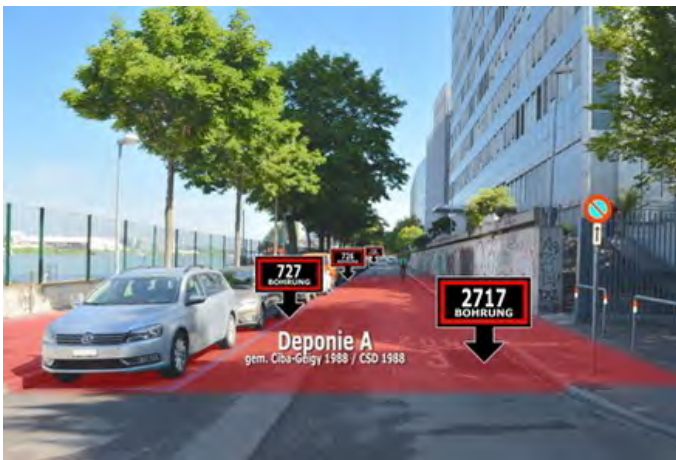
z. B. Sondermüll auf Allmend im Basler Stadtteil Klybeck: Deponie und Bohrungen im Unteren Rheinweg.

Die Behörden des Kantons Basel-Stadt haben die Altlastenverordnung im Stadtteil Klybeck nur in Ansätzen umgesetzt. Deshalb wissen sie bis heute nicht genau, wo auf den Chemiegeländen der BASF AG und der Novartis AG sowie auf öffentlichem Grund belastete Standorte vorkommen, die saniert werden müssen. Zu diesem brisanten Schluss kommt ein Gutachten des Basler Altlastenspezialisten Martin Forter, das die Ärztinnen und Ärzte für Umweltschutz (AefU) heute veröffentlichen haben.