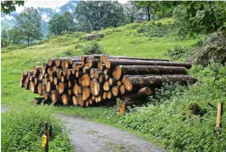
Dieser Holzpolder bei Engi (GL) liegt in der Grundwasserschutzzone S3. Entgegen den gesetzlichen Vorgaben scheint das Rundholz ohne Schutzvorkehrungen mit Insektiziden besprüht worden zu sein.