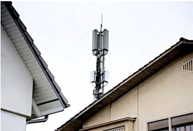
Bald höhere Strahlenbelastung der AnwohnerInnen? 5G-Sender auf einem Wohnhaus.