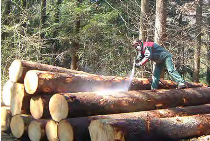
Gefällte Baumstämme werden mit hochgiftigen Insektenmitteln behandelt.