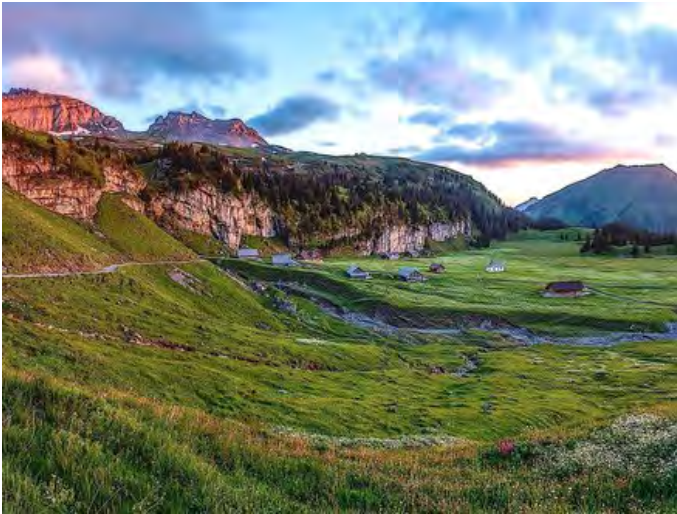
Schauplatz der 1. Nationalen Landsgemeinde fürs Klima: Alp Aelggi (OW).

Ärztinnen und Ärzte laden zum 1. August auf Alp Aelggi, Sachseln, OW, im geografischen Mittelpunkt der Schweiz zur 1. Nationalen Landsgemeinde fürs Klima ein. Ihr Ziel: