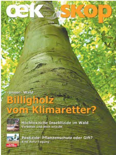
OEKOSKOP 1/19: Unser Wald: Billigholz vom Klimaretter?