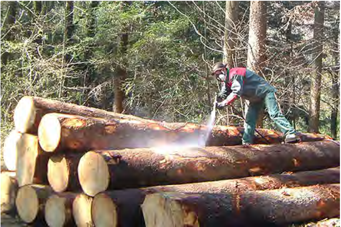
Gefällte Baumstämme werden mit hochgiftigen Insektiziden behandelt.