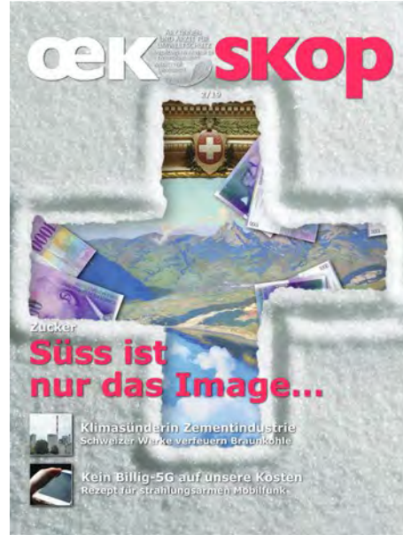
OEKOSKOP 2/19: Zucker: Süss ist nur das Image ...