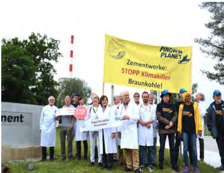
Die Schweizer Zementwerke verfeuern über 110'000 Tonnen des Klimakillers Braunkohle.

Die Schweizer Zementwerke verfeuern jährlich mehr als 110 000 Tonnen Braunkohle. Braunkohle ist der denkbar dreckigste und klimafeindlichste Brennstoff überhaupt. Die Ärztinnen und Ärzte für Umweltschutz (AefU) und Pingwin Planet (PP) fordern ein Braunkohle-Verbot.