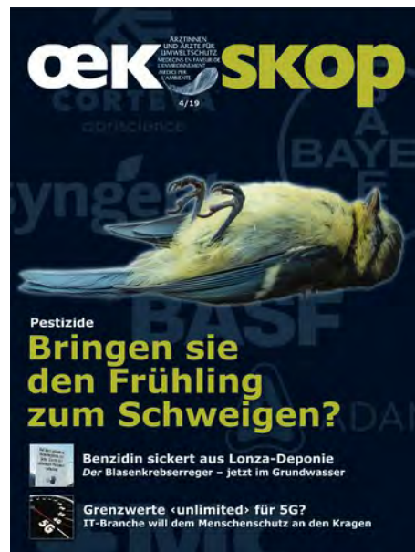
OEKOSKOP 4/19: Pestizide: Bringen sie den Frühling zum Schweigen?