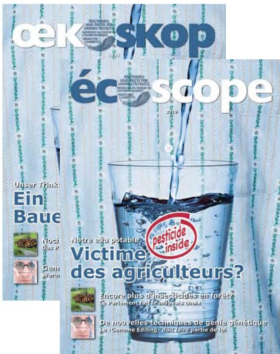
Ecoscope 2019: Notre eau potable: Victime des agriculteurs?